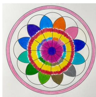
(曼陀罗心理绘画作品示例)